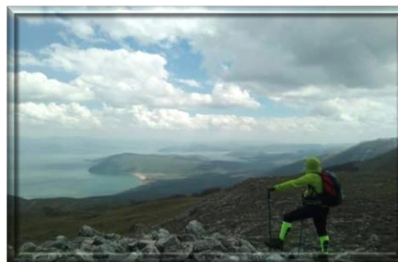
Pogled na Ohridsko jezero