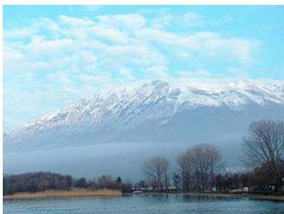
pogled na Galičico iz Ohridskega jezera