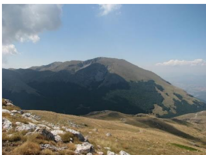
Najvišji vrh gorovja, Magaro