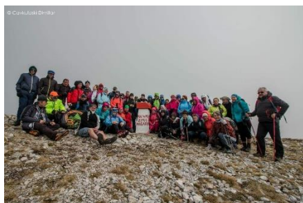
Pohodniki SNO 2017 na Magaru (2255m)