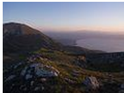
pogled iz Galičice na Južni del Ohridskega jezera