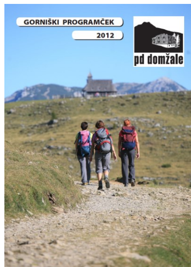
Gorniški programček 2010