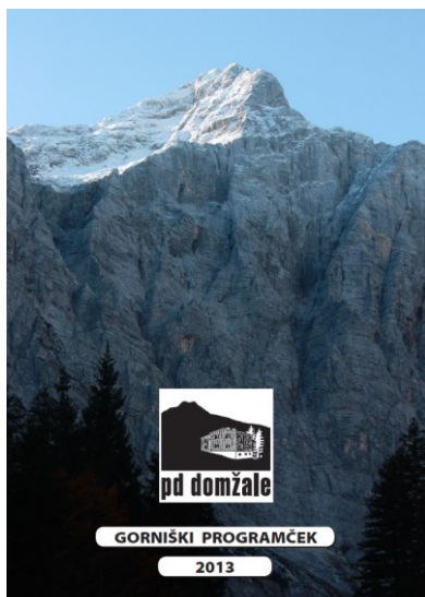
Gorniški programček 2011