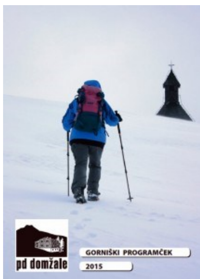
Gorniški programček 2013