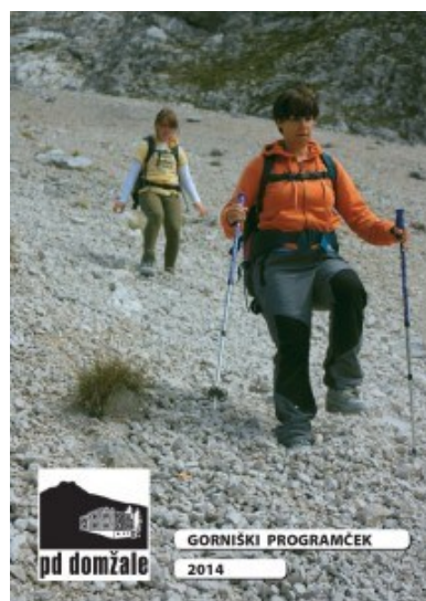
Gorniški programček 2012