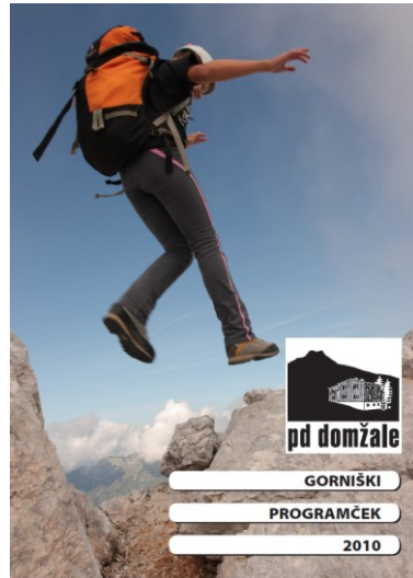
Gorniški programček 2008