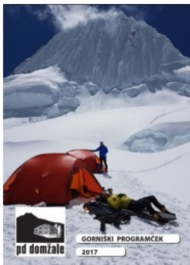
Gorniški programček 2015