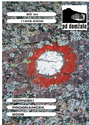
Gorniški programček 2006